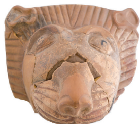
Abb. 1: Abb. 2, 4 Abb. 3