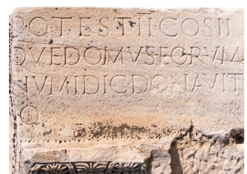
Abb. 1: © Sven Page